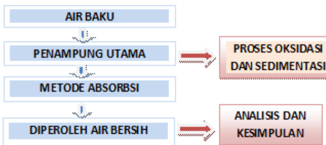
Gambar 1: Diagram Alir Sistem Penjernih Absorpsi Termodifikasi.

Pelaksanaan pembangunan sistem pemjernih air melalui saringan pasir lambat dengan metode absorpsi dan optimasinya ditunjukkan oleh Gambar 1.